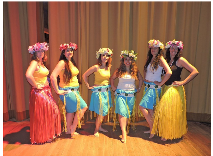
Fête des mères