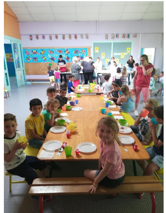
Petit déjeuner de l'école maternelle