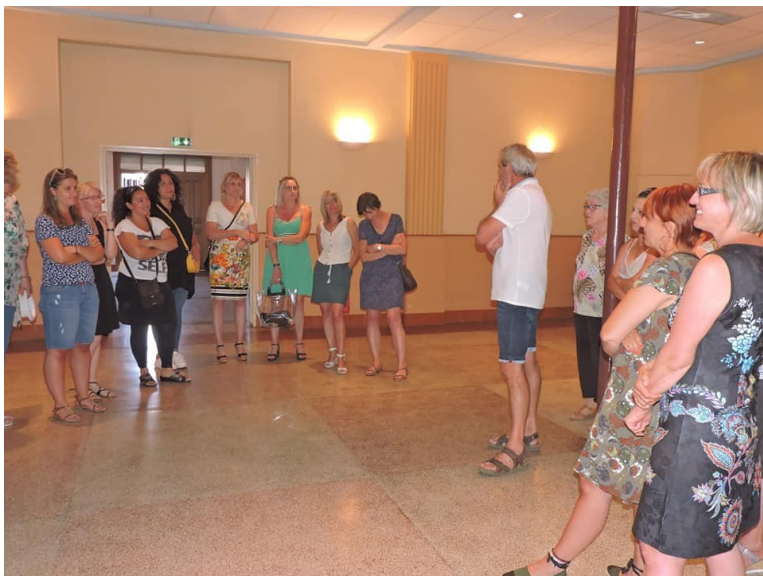
Réception des enseignants