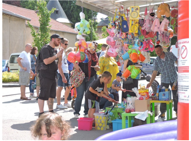
Fête au village