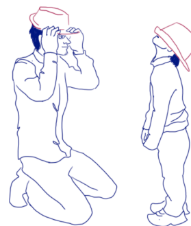
Dessin réalisé à partir de l'affiche du Film Planète Autisme par Charline Pierret

https://autisme.tv5monde.com/portfolio/erwan-imitation/