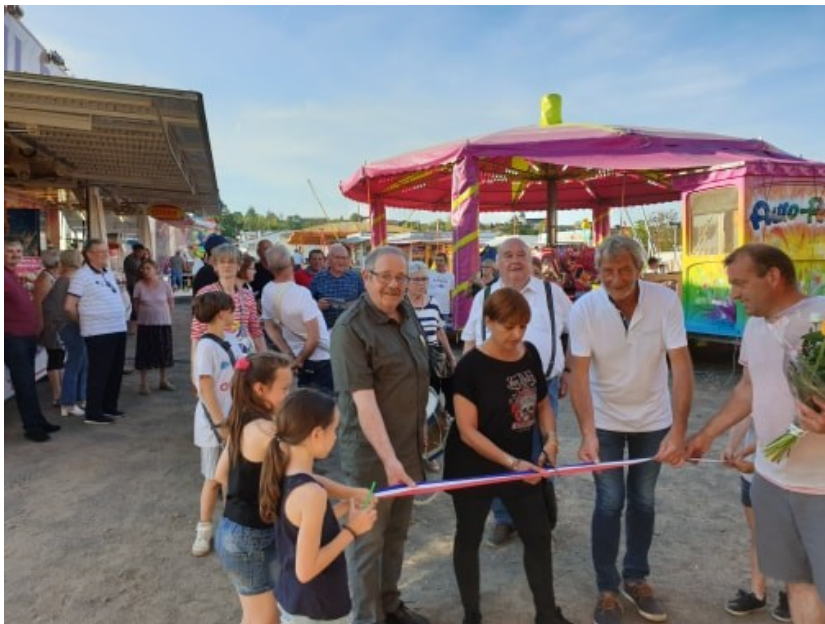
Inauguration de la fête foraine